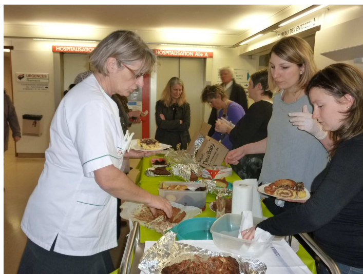
Affluence devant le stand de gâteaux maison !

Prochaine action : une soirée dansante en fin d'année 2012.