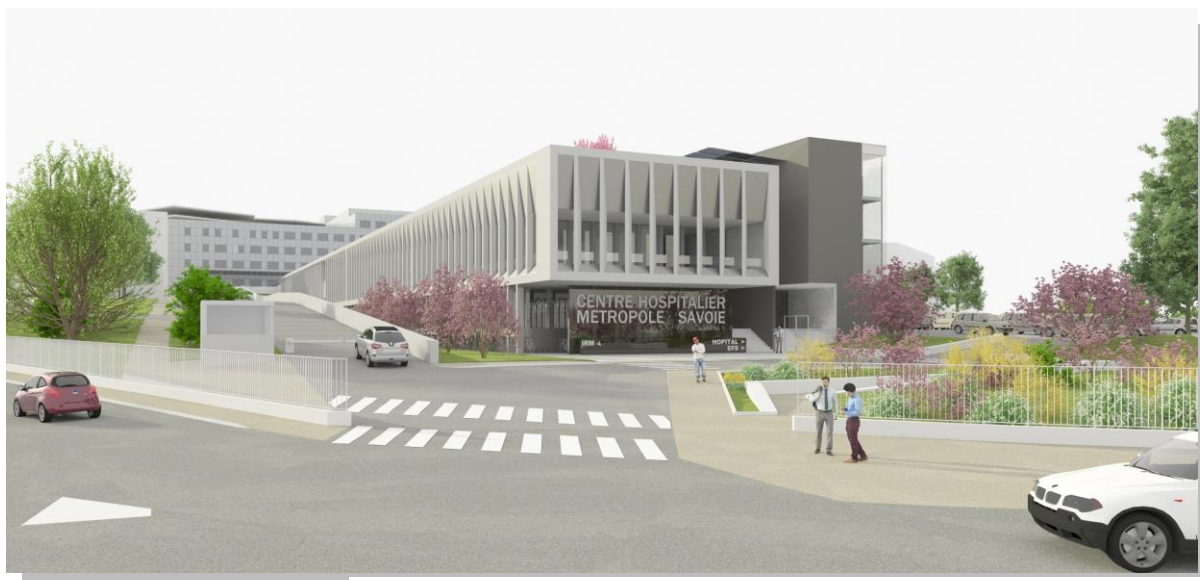
Vue depuis le rond-point Biset en provenance du centre-ville